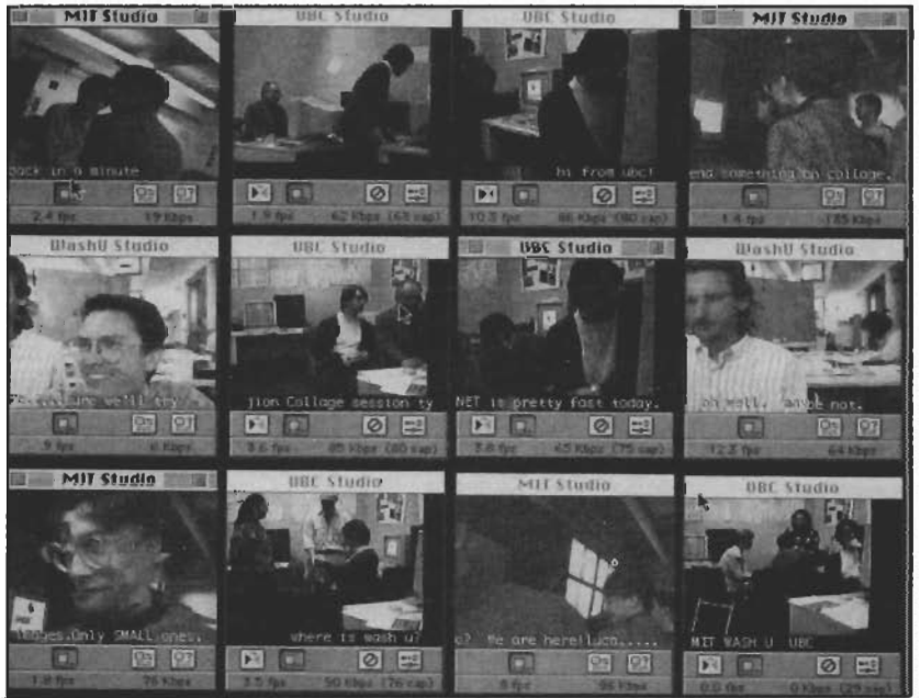
Şekil 2- Macintosh ortamında yapılan bir etkileşimli video çalışması

d. Aynı bilgisayarlardaki çoklu ortam belgelerinin tek merkezden oynatımı: Bu yöntemde izleyicinin bilgisayarına konuşmacının sunacağı çoklu ortam belgesinin kopyası önceden gönderilir. Daha sonra söz ko-