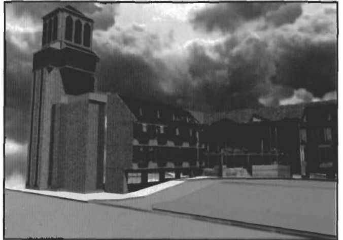
Şekil1- Rusya'da bir otel. Yazılım: Starata Studio Pro 1.0, Donanım: PowerMac 8100.

Önceleri doğada bulunan taş, mağara duvarı gibi yüzeyler üzerinde şekillenen tasarım, kişiler arasındaki iletişimi daha da hızlandırmak ve gördüğümüz evren içindeki tasarlanmış şekillerin bireylerin ayağına